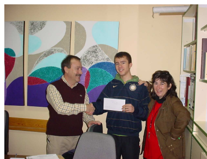
Concurso de fotografía