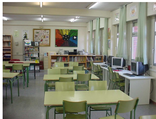
Biblioteca abierta en horario de tarde

En el IES Satafi se vienen realizando esfuerzos para fomentar la lectura entre los alumnos desde hace años. El curso pasado desarrollamos un proyecto de dinamización de la biblioteca , en el que participaron un gran número de profesores; se llevaron a cabo una serie de actuaciones, que tuvieron como resultado un aumento del índice de lectura entre los alumnos: se adquirió un número considerable de libros y DVD, se instalaron más ordenadores con conexión a Internet, se agilizó el sistema de préstamos, se realizaron actividades de consulta de material bibliográfico en la biblioteca, se organizaron actividades como cuentacuentos y visitas a la biblioteca del Centro Cívico, etc. Durante este curso vamos a poner en práctica en un 1º de ESO una actividad denominada "La maleta viajera", para fomentar la lectura en el ámbito familiar. Si se cumplen nuestras expectativas, ampliaremos la actividad al resto de los grupos de ese nivel.