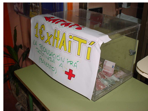
Actuaciones Solidarias: ayuda para Haití